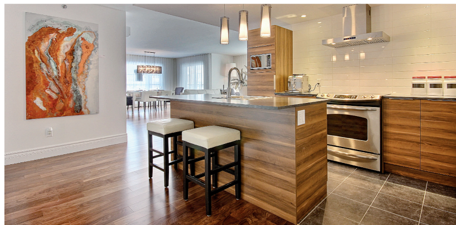
Espaces de vie à aire ouverte, généreuse fenestration et finition intérieure correspondant aux exigences du propriétaire: les condos le S16 ont tout pour plaire.